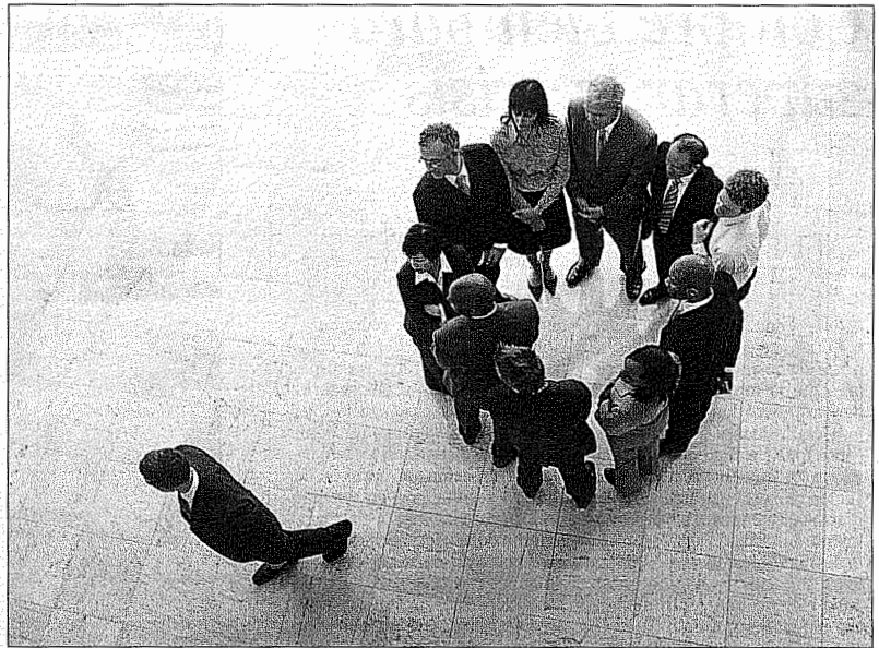
Con un director medio, el 25% de la plantilla se plantea cambiar de trabajo. Si es bueno, el 16%.

En cuanto a las prioridades a que se refieren los trabajadores a la hora de designar a las empresas entre las mejores en las que trabajar figuran: un salario coherente con el puesto a desempeñar, que la firma tenga posibilidades de desarrollo y promoción, que sea reconocida, que cuente con políticas de conciliación, que haya una buena relación con los jefes directos, que los valores corporativos de que presume la empresa fuera sean asumidos dentro de la organización, que haya igualdad de oportunidades entre hombres y mujeres, que los objetivos de la empresa se vean reflejados en los del personal y que tengan reputación los altos directivos de la empresa y, por ende, ésta, según Villafañe. ■