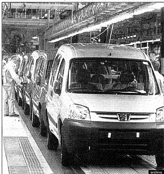
La planta de PSA en Vigo es la primera de España en producción.

España, pese a conservar el tercer lugar en Europa con 2,88 millones de unidades (+4%), cae un puesto en la clasificación mundial al verse superada por Brasil, que experimenta un significativo crecimiento del 13,8% y alcanza 2,97